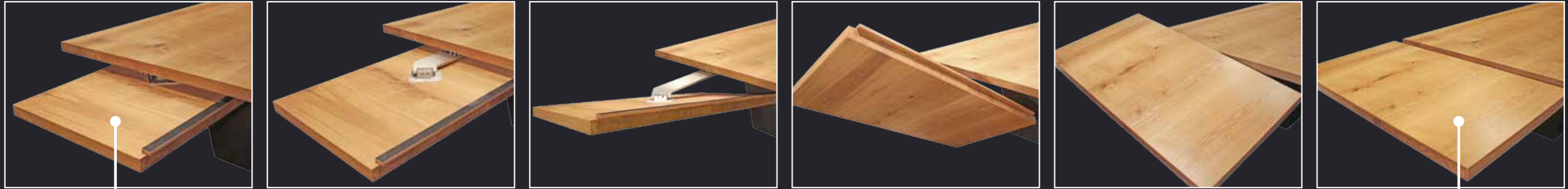
Tischverlängerung im Handumdrehen