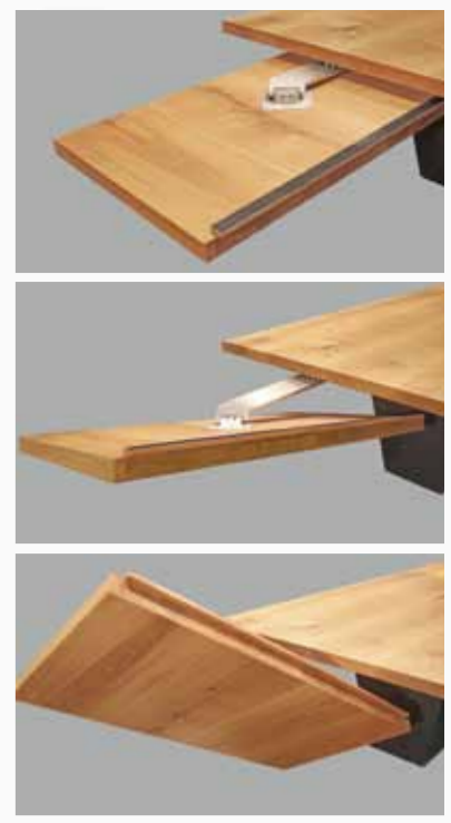
Tisch Solid mit „Twister“ Verlängerungsmechanik. Table Solid with "Twister" extension mechanism.

Natural shapes and materials: base in raw steel and a solid table top are the characteristics for the Solid. Picture shows model in Black Walnut with sapwood and rough edges (240 x 90 cm, thickness 4.2 cm). Available in different woodtypes and sizes from the Schulte Design collection.