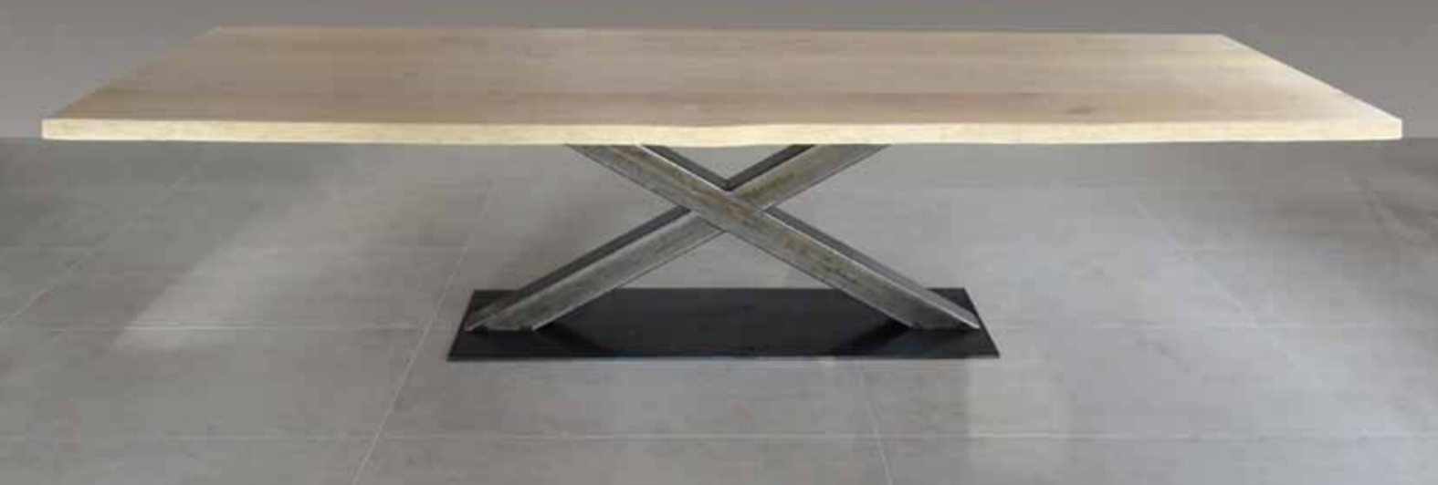
Table with x-form raw steel base, table top in oak with rough edges. Measurements: 250 x 100 cm.

Tisch mit Stahl-Untergestell in X-Form, hier mit Tischplatte aus Eiche mit Baumkante. Maße: 250 x 100 cm.